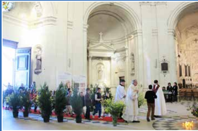
Passage de la Porte Sainte à N-D des Ardilliers ; cérémonie organisée par les fraternités paroissiales de Charles-de-Foucauld

La fraternité entre ainsi dans une dimension maternelle, comme celle de Marie au pied de la