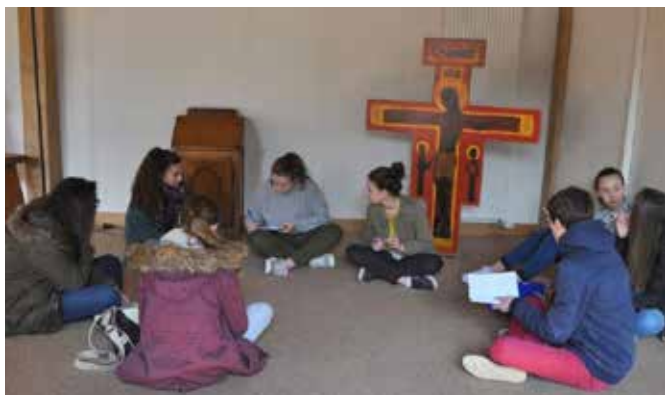
Temps fort à Charles-de-Foucauld pour les jeunes se préparant à la confirmation.

Actualités des Paroisses Chrétiennes de Saumur n° 39