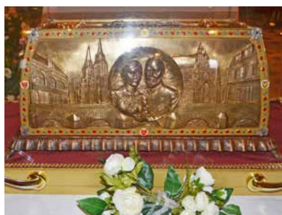
< Les reliques de Louis et Zélie Martin, parents de Sainte-Thérèse-de-Lisieux, ont visité a paroisse Charles-de-Foucauld