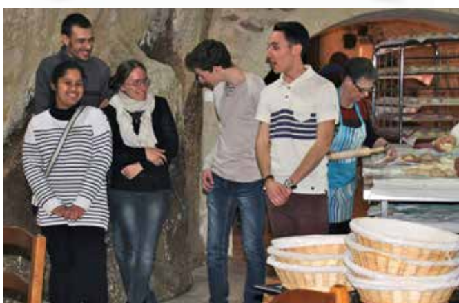
< Soirée fouées proposée par les jeunes qui assisteront aux JMJ.