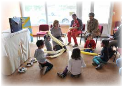
Eveil à la foi à Notre-Dame-de-Nantilly

■ Enseignants avec les enfants de CE2-CM1-CM2