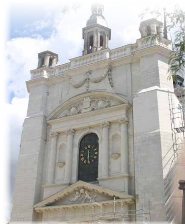
L'église Saint-Pierre. Nous avons ressenti de l'émotion au retrait de l'échafaudage ; elle a pris de la grandeur, elle redonne à notre ville un nouvel éclat que les siècles avaient terni. Chacun peut admirer cette façade et nous sommes ravis que les Saumurois, les catholiques mais aussi les touristes, puissent se l'approprier. Un grand merci aux entreprises et à ceux qui ont financé les travaux.