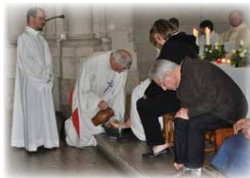
Jeudi Saint, lavement des pieds à la Communauté Jeanne Delanoue