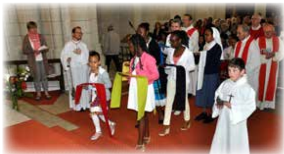
Le 24 mai, dimanche de la Pentecôte, messe des Peuples à N-D de Nantilly