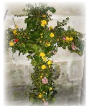
Après-midi de Pâques avec l'aumônerie des gens du voyage